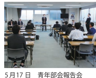
5月17日 青年部会報告会