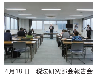
4月18日 税法研究部会報告会