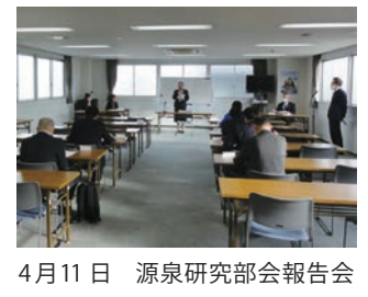
4月11日 源泉研究部会報告会