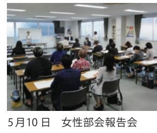
5月10日 女性部会報告会