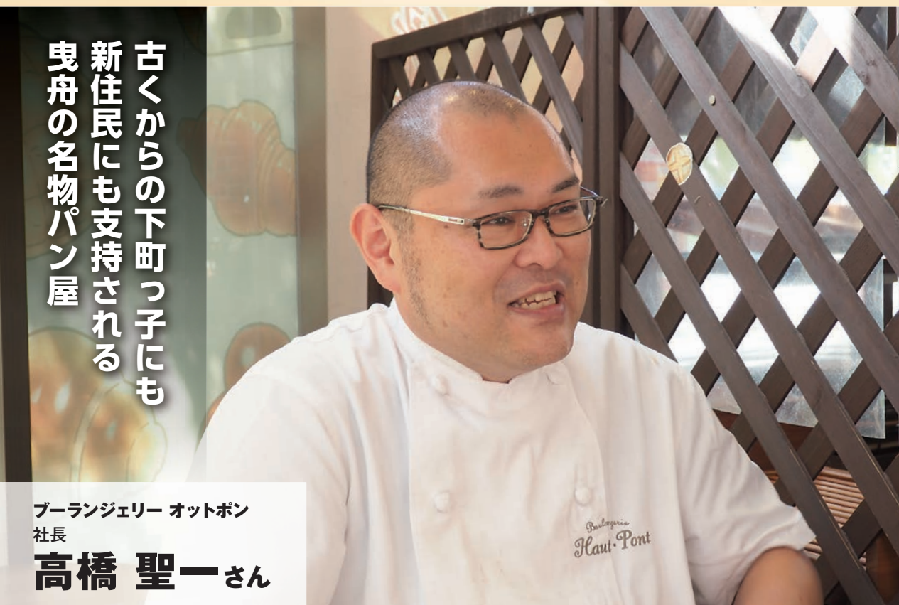
ブーランジェリー オットボン 社長