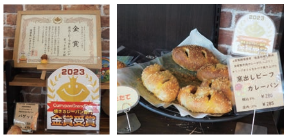
金賞受賞のカレーパン。焼いてあるので何個でもペロリといけます。

一番の売れ筋は食パンですね。乳製品と卵を一切使っていないので、アレルギーがあるお子様でも安心して食べられて、ファミリーに人気の商品です。また、焼きカレーパンは最近カレーパングランプリで金賞を受賞しました。「揚げ」と脂っこくて重いという声があったので、じゃあ焼いてみるかということでしたところ大好評です。他にも塩バターロールやベーグルも人気があります。