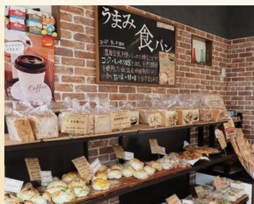
豊富な種類のパンが 所狭しと並んでいます。

2012年の12月に開店したのですが、翌春の4月にひきふね図書館が開館するまでは閑古鳥でした。11年間で一番大変だったのが開店当初なのは間違いありません。私の感覚では最近ようやくお店の売上が安定してきたなと感じています。