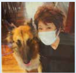
常連さんのワンちゃんとパチリ

ちゃんが一緒に食事をできるお店にしようということ、ワンちゃん用のメニューも用意しました。お母さんはすき焼き、ワンちゃんはサーロイン肉を食べて帰られる方もいます。