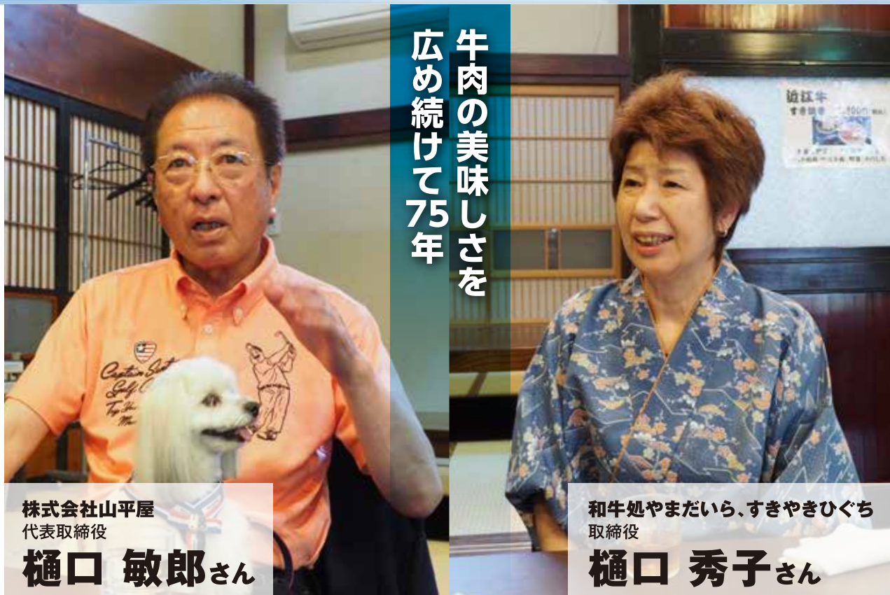
和牛処やまだいら、すきやきひぐち 取締役