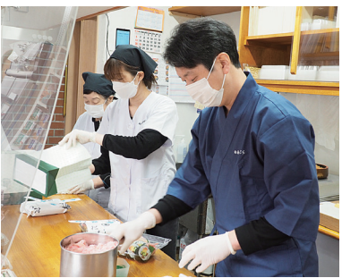
息の合った連携でおいしさをお届けします。

一方、地域の賑わい自体は昔に比べると寂しくなりまし たね。もともと当店の並びは4のつく日は縁日になる商店街で、当日は屋台が並び自転車も通れないくらい人手があつたんです。それが少子化やお店が少なくなつた影響で寂れてきて、去年