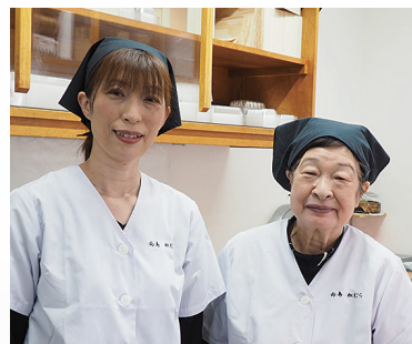
長年「松むら」を支えるお二人。

一番大切にしているのは「変わらない味」ということ。90年くらい継ぎ足して使っているタレもその一つです。毎日味がぶれないような仕込みになるように気を付けています。