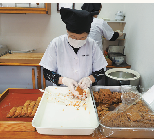
油揚げにご飯を詰め込むのは一つ一つ手作業。できたそばから飛ぶように売れていきます。

27歳の時に一回実家に戻り、煮方や巻き方まで、お店に関わることを全部父から教わりました。父の仕込みは本当に厳しかったですね。横でずっと見ていてダメなところがあつたらすぐに指摘される。