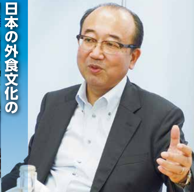
丸源飲料工業株式会社 代表取締役社長