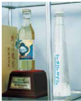
昔懐かしいトーキョーサイダー

専務:「1916年に当時最先端の飲料だったラムネの製造販売を始めて以降、時代のニーズに応える製品を開発してきました。現在は主に外食産業の業務用を使用する飲料やシロップ、トッピング、カットフルーツなどの開発製造を手掛けています。1974年には今でも業務用や贈答用に人気の高いチョコレートドリンクをリリース。1998年にはフロージンスムージーベースをリリースしました。どちらも発売当時は日本にほとんど飲む習慣がなかった商品です。」