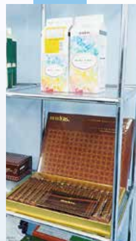
上段の商品がモノジュエル 下段がチョコレートドリンク

社長:「当社の製品はおいしいと評価されることは多かったですが、女の子がかわいいと喜んでくれる商品はこれまで一つもなかった(笑)。若手社員のアイデアを取り入れSNSや写真が盛んな世の中の流れに合わせることで、モノジュエルは初めて一般の人にも認知される製品になります。当社の「もっとたのしく、もっとおいしく。」をわかりやすく体現する存在となりました。」