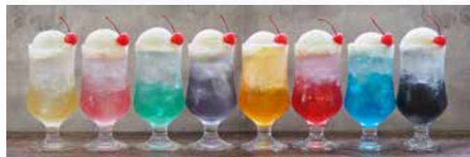
カラフルな色で楽しませてくれるモノジュエル

専務:「モノジュエルはキャラクターやスポーツチームなどのコラボレーション展開も盛んです。全八色あればキャラクターカラーやチームカラーを大体カバーできます。さらに特徴は黒色を用意していること。黒がテーマカラーのキャラクターやチームはすごく多いのですが、飲料で黒を表現できる製品は少ない。モノ