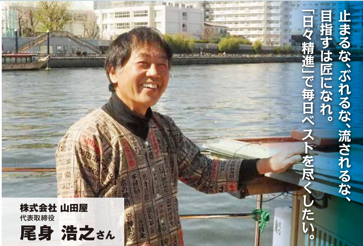
株式会社 山田屋 代表取締役