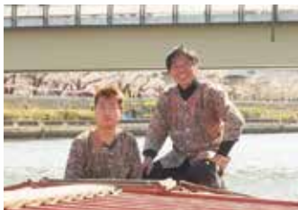
山田屋の5代目を継ぐ長男さん(左)

教えたことを着実に身に付けて いってくださる姿は、船長として 責任を持って成長してくれているの