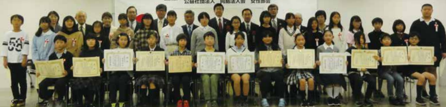
第9回 税に関する「絵はがきコンクール」表彰式