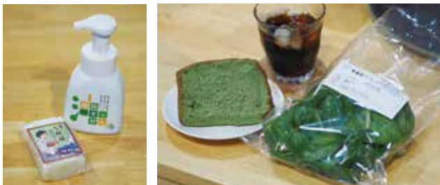
油で作られたオリジナル石鹸も販売中。甘すぎずさっぱりとした味が人気です。