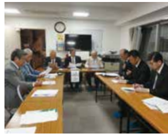
墨田第三支部 5月14日