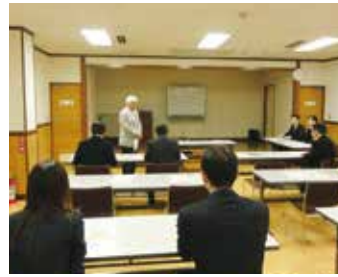
墨田堤通支部 5月8日