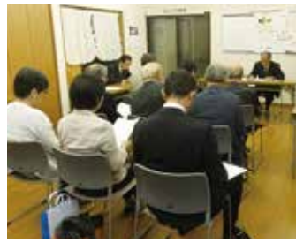
立花第三支部 4月26日