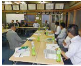
墨田第五支部 5月29日