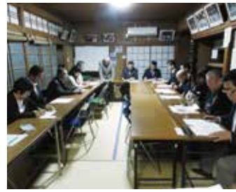
東向島第五支部 5月7日