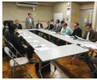
八広第三支部 5月28日