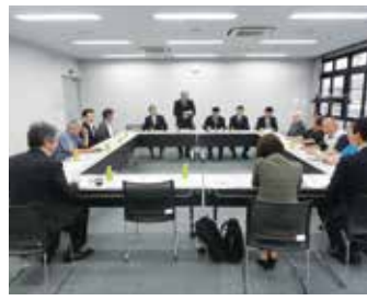
八広第二支部 5月17日