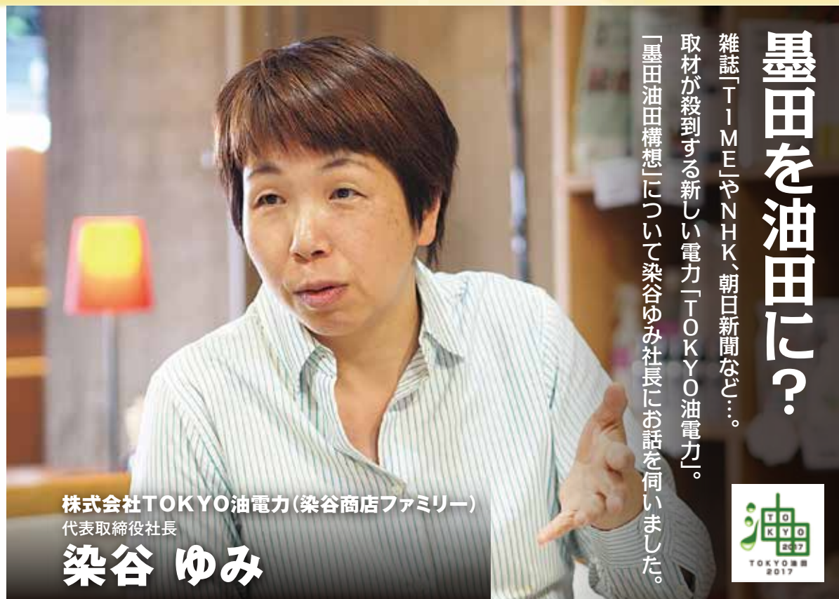
株式会社 TOKYO 油電力 (染谷商店ファミリー) 代表取締役社長