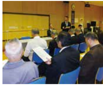
立花第二支部 5月10日