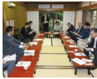
東向島第一支部 5月21日