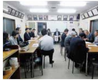
東向島第三支部 5月9日