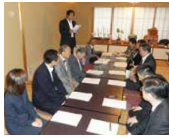
八広第五支部 5月11日