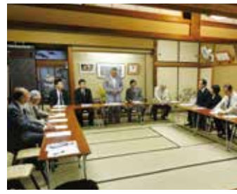
押上文花支部 5月23日