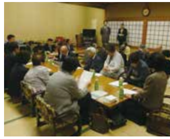
八広第一支部 4月19日