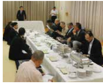
立花第一支部 5月16日