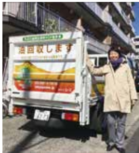
油を回収するトラック