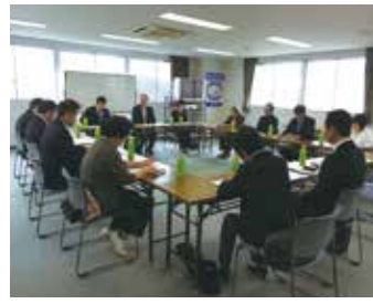
東向島第二支部 4月25日