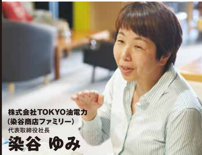
株式会社TOKYO油電力 (染谷商店ファミリー) 代表取締役社長

雑誌「TIME」やNHK、朝日新聞など…。 取材が殺到する新しい電力「TOKYO 油電力」。 「墨田油田構想」についてお話を伺いました。