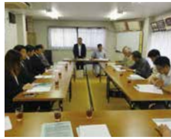
墨田第二支部 5月24日