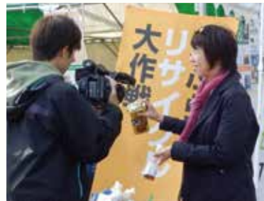
テレビ局の取材を受けるゆみ社長