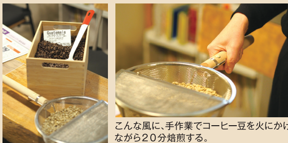
こんな風に、手作業でコーヒー豆を火にかけてながら20分焙煎する。

私はこの仕事を20年、1日たりとも辞めたいと思つたことがありません。ダメダメな私に神様がプレゼントしてくれたのだと思います。