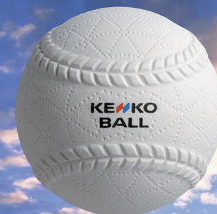
(公財)全日本軟式野球連盟公認球 ケンコーボール