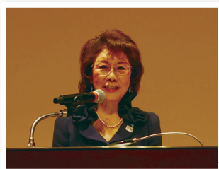
東法連女連協会長