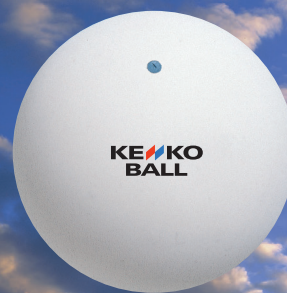
(公財)日本ソフトテニス連盟公認球 ケンコーソフトテニスボール

1934年創業以来80年以上にわたり 一心にボールを作り続けてまいりました。 これからもスポーツライフに相応しい自信作をお届けしていきます。