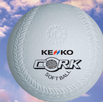
(公財)日本ソフトボール協会検定球 ケンコーソフトボール