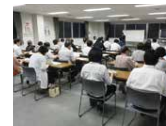
青女合同税務懇談会 9月6日

平成30年9月9日から10月1日まで「消費税率軽減税率」をテーマに、税金クイズを取り入れたブロック別研修会を6回開催しました。