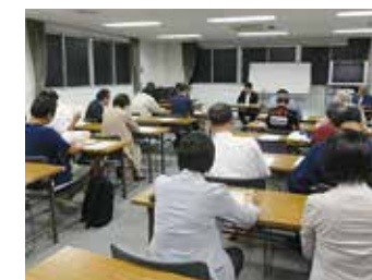
3B 税務懇談会 9月13日