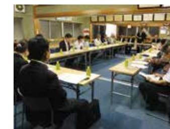
1B 税務懇談会 9月21日