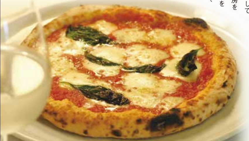
薪釜で生地をパリッと焼き上げたマルゲリータは、アツアツのトローリとしたチーズが絶品。白ワインと一緒に食すと、至福のひと時です。

「地元との交流は父のやることと長いこと思ってきましたが、4年前に友人の誘いで参加することに。それが、店をご利用いただいたり、ケータリングをご利用いただく機会にもなっています。縁のないことだと思いましたが、よい変化にも刺激にもなっています。」