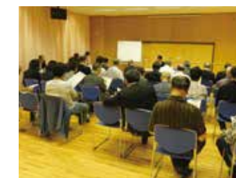
4B 税務懇談会 9月25日