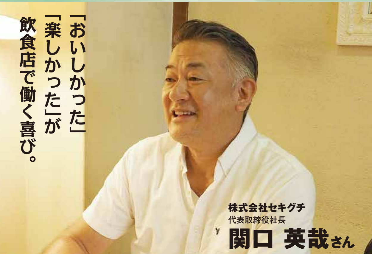
株式会社セキグチ 代表取締役社長