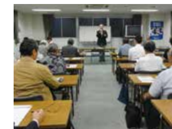
2B 税務懇談会 9月12日