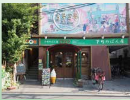
東向島の本店。1階がベーカリー、2階がイタリアン