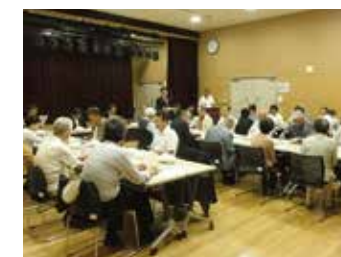
5B 税務懇談会 10月1日